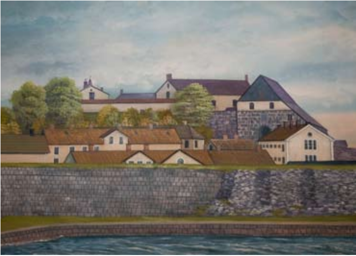
Varbergs fästning målad i olja av Arvid Lindoff, 1908.

ria, bland annat genom en samling tavlor med Varbergs fästning i fokus. I anslutande salar finns också generösa utrymmen för diskussion och debatt.