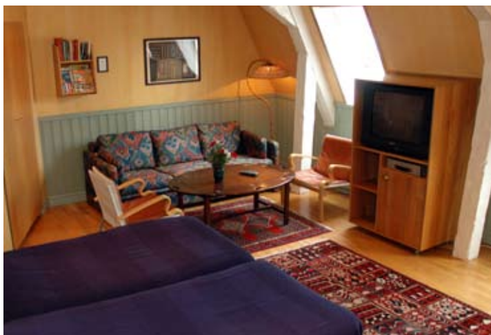
Takbjälkar från 1700-talet och sneda väggar är det inte ont om på Gästis.