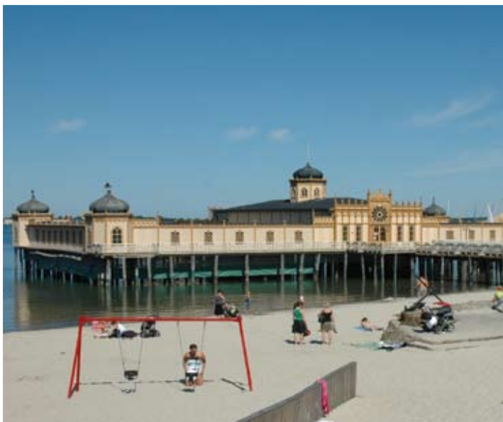
Varbergs vackra kallbadhus vid Barnens badstrand och dess myllrande badliv.