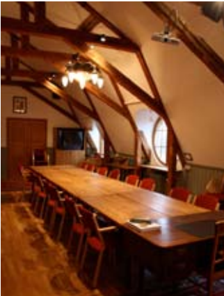
Otto Torellsalen i viloläge.

Att lämna sin vanliga miljö för att äta gott, botanisera bland böcker, röka en äkta Havanna i rökssalongen, slappna av i Leninbadet eller bara meditera i gammal hotellmiljö frigör den kraft som behövs för att tänka stort och rätt. Hotell Gästis stämning och atmosfär har fått många konferensgäster att återkomma gång på gång på gång. Här har planer gjorts upp och problem blivit lösta.