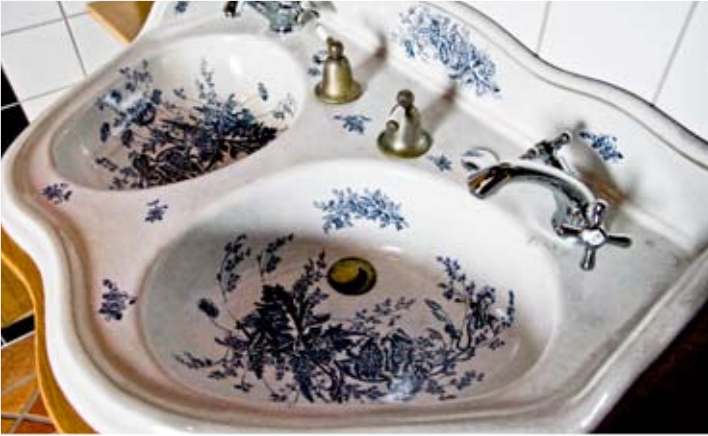
Dubbelhandfat från Rörstrand med sirliga blomstermotiv, ca 1890.

Rehnholm. I denna fanns ett flertal föremål som liknade dem som smyckat det ursprungliga Leninbadet. Då Rehnholms änka vägrade se sin makes samling skingras kom Gästis att överta allt och bli ägare till Sveriges största Leninsamling. Utvalda delar inreder kurbadet och kan ses av de badande.