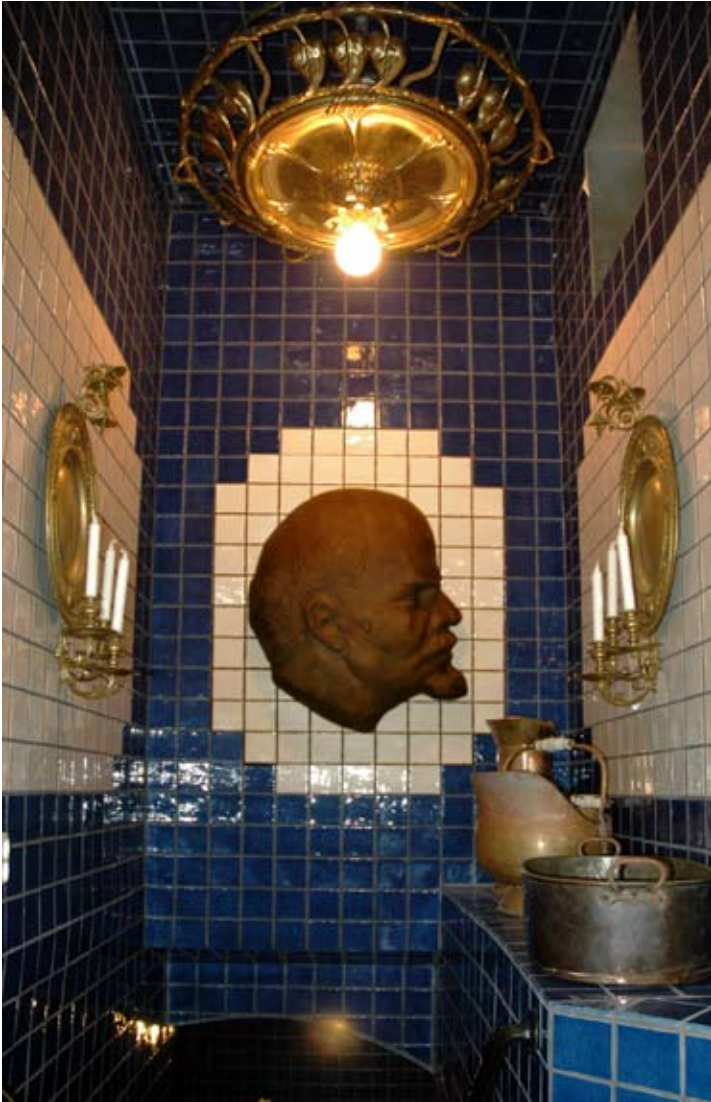
Trapphallen ner till Leninbadet med taklampa från filmen Gorkijpar- ken och mäktig Leninrelief i brons.