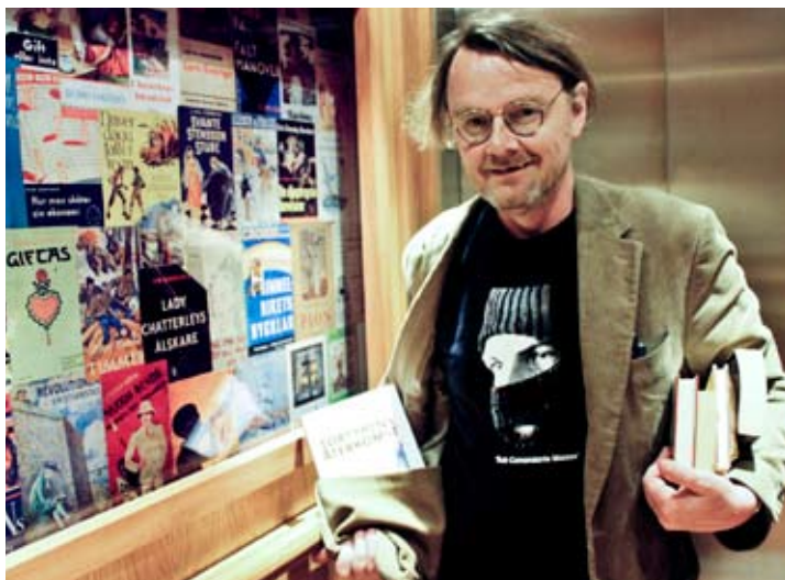
Hotelldirektören med böcker och kavajens specialsydd bokfickor framför hissens rörliga vägg med bokomslag.

Gästis hyllor fylls på av Varbergsbor som kommer förbi med några lådor ärvda böcker, av secondhandaffärer som får in mer än de kan sälja och av hotellgäster som lämnar kvar en kasse när de flyttar.