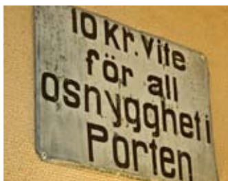
Uppförandekod för gäster och personal i hotellets entré.

Tillsammans med fem tusen glasspinnar är kapsyler- na en av få samlingar som ännu inte representeras i hu- set. Här finns däremot mer än två tusen tryckalster från all världens museishoppar. På Gästis väggar blandas de