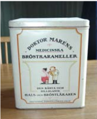
Hotellet värnar gästernas mentala och fysiska hälsa.

hotell med sextio rum, sjuttio toaletter och en hiss. Under dessa år har hotellet också fyllts av mer eller mindre värdelösa samlarobjekt.