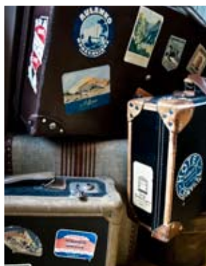
Vittberesta resväskor kvarglömda på Gästis.

– Genom samlingarna lever det gamla gästgiveriets enkla och generösa själ vidare, menar hotellets ägare. Att samla är ett sätt att leva och precis som alla livets upplevelser är intressanta finns det ingenting som inte är värt att spara på.