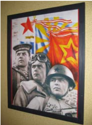
Den tyska fascismens banemän.

Förutom det Torellska huset från 1700-talet består Hotell Gästis av ytterligare fyra gamla hus som är sammanbyggda genom vindlande korridorer och osannolika trapps-system. Av hotellets sextio personligt inredda rum är inget det andra likt. Storlek, form, takhöjd och inredning skiljer från rum till rum medan standard och teknik är densamma. Karaktäristiskt för rummen