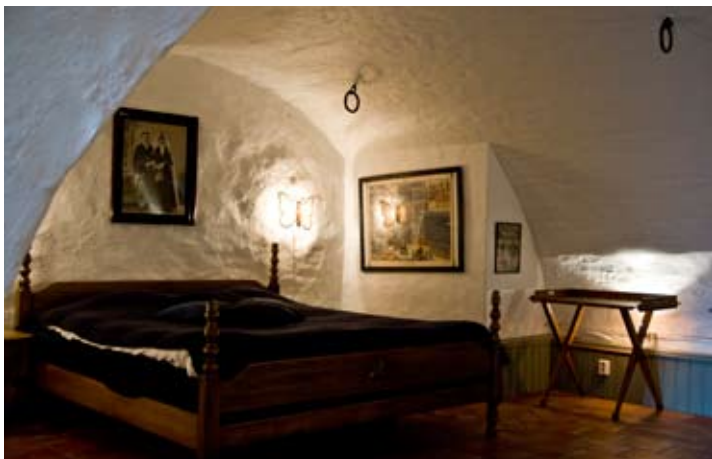
Bröllopssängen under romantiska fjärilslampor och ett bröllofsfoto av hotellägarens mormors föräldrar som levde lyckliga i alla sina dagar.

Mitt över gatan ligger hotellets annex – Villa Gästis – med sina elva rum i en gammal privatvilla från 1894. Hela detta hus är fyllt av bilder från den mexikanska konstens guldålder, från Diego Rivera till Frida Kahlo. I den gamla välvda källaren från 1600-talet finns Gästis bröllopssvit. Källarrummet med dess metertjocka tegelväggar var allt som blev kvar efter en förödande brand 1889. Hotellets andra svit huserar i det som fram till sekelskiftet 1900 var gästgiveriets stall. Den har separat ingång från gården och är inredd med ett litet kök för dem som vill hushålla själva.