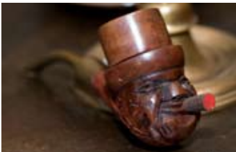
Winston Churchill som pipa.

Gästis matsalar var ett begrepp i Varberg under mer än femtio år. Hit kom ungarlar för att äta middag, många hade till och med fasta platser och kunde lämna sin servett och en halv flaska vin till dagen därpå. Fortfarande uppskattar husets besökare att kunna avsluta kvällen med en cigarr och en avec ur hotellets omfattande