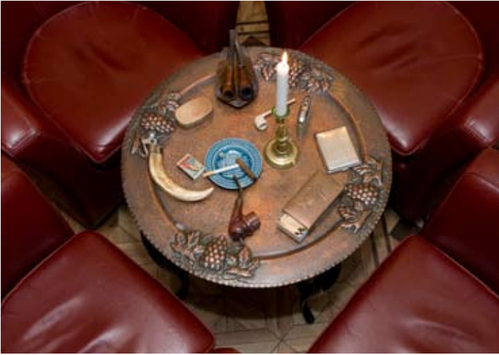
Pipor och cigarrsnoppare på klassiskt rökbord.

förhatliga röksalongen i sällskap med en pipa eller en noggrant utvald Havannacigarr från hotellets stora specialutbud. Här finns också hotellägarens olika samlingar av rök- och tobakskuriosa.