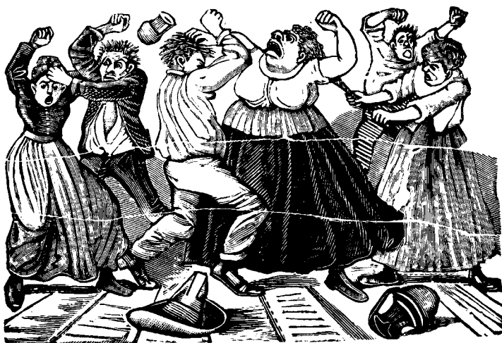
Redan under 1800-talet var Gästis populärt bland vanligt folk i Varberg.

bara ett tiotal mycket enkla rum jämte krog med mat, öl och brännvin. Bland de resande hade Gästis inte alltid det bästa ryktet. Men varbergsborna, som sällan var ute och reste, tyckte det var ett spännande hus där det söps, slogs och skvallrades.