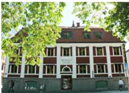
Torellska huset sett från Engelska parken.

I ett rött hus mittemot Engelska parken ligger Varbergs äldsta hotell. Dess gäster märker snart att det är ett annorlunda ställe. Det bad som finns i 1700-talskällaren är byggt som en kopia av Lenins favoritbad.