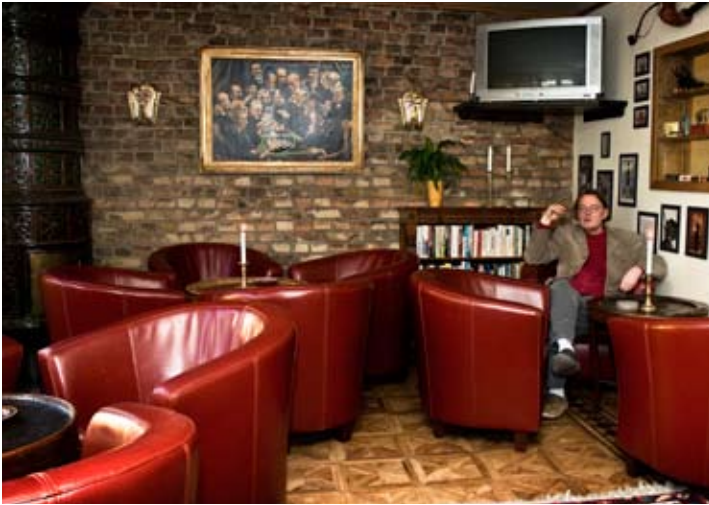
En god Havanna i röksalongen.

Gästis matsalar var ett begrepp i Varberg under mer än femtio år. Hit kom ungarlar för att äta middag, många hade till och med fasta platser och kunde lämna sin servett och en halv flaska vin till dagen därpå. Fortfarande uppskattar husets besökare att kunna avsluta kvällen med en cigarr och en avec ur hotellets omfattande