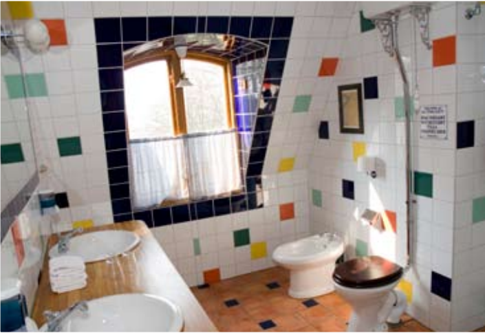
Ståndsmässig toalett med vy över Engelska parken.

hotell med sextio rum, sjuttio toaletter och en hiss. Under dessa år har hotellet också fyllts av mer eller mindre värdelösa samlarobjekt.