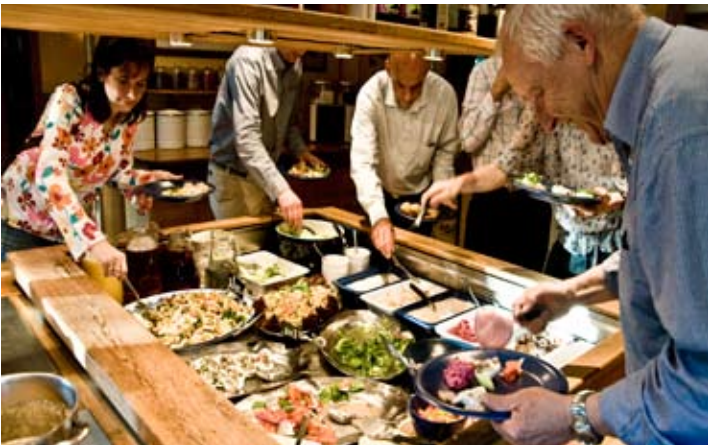
Vid buffén får gourmanden sitt lystmäte.

Varje kväll serveras en imponerande middagsbuffé i Gästis ombonade matsal. Utan extra kostnad kan hotellets gäster välja bland två hemlagade rätter, salader, kallskuret, bröd och pålägg, ostbricka och sen avsluta med kaffe och kaka. Vill man riktigt slå på stort låter man kocken visa varför han fått alla utmärkelser och ordna en tre- eller femrätters lyxmiddag.