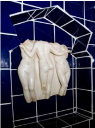
Nisch med ryska badnymfer.

Med hundratusen koboltblå kakelplattor skapades så en kopia av Lenins favoritbad i det Torellska husets källare. År 2007 stod det färdigt med hetbad, kallbad,