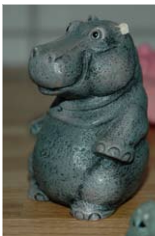
En av hundra nöjda flodhästar efter badet.

fick det klart överdrivet beröm och i Amelia Adamos M-magasin omskrivs det som ett av Sveriges trendigaste spa. Det ursprungliga Leninbadet levde kvar fram till början av 1990-talet och frekventerades av partifolk, förtjänta arbetare och tjänstemän som använde Smolnij som rekreationscenter. Idag har det stängt.