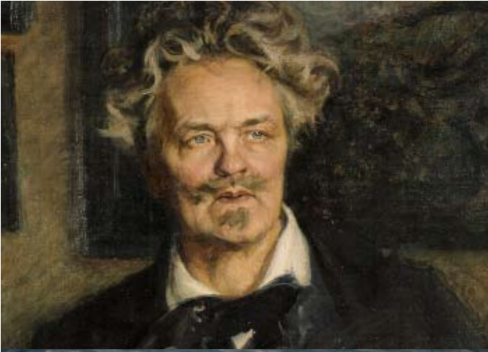
Titanens visionära blick inspirerar i Strindbergssalen.