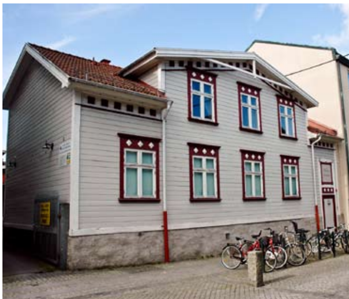
Hotell Gästis annex, Villa Gästis, inrymt i en gammal privatvilla.