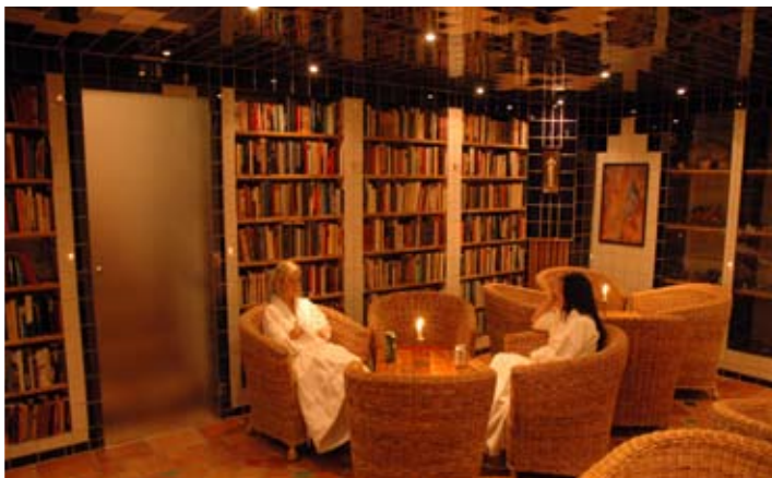
Avslappnande samtal i Leninbadets bibliotek.