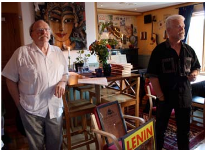
Jan Myrdal gratulerar den ytterst olydige författaren Mattias Gardell, den förste mottagaren av Jan Myrdals stora pris – Leninpriset. I bakgrunden relief av Torsten Jurell.

– Helt normalt, skrockar Jan Myrdal förtjust.