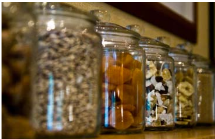
Gott och blandat till frukosten.